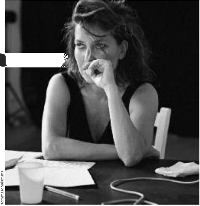
Tommaso Salamina Giulio Mazzi

Accademia di Svezia, Premio Nobel per la Letteratura 1997